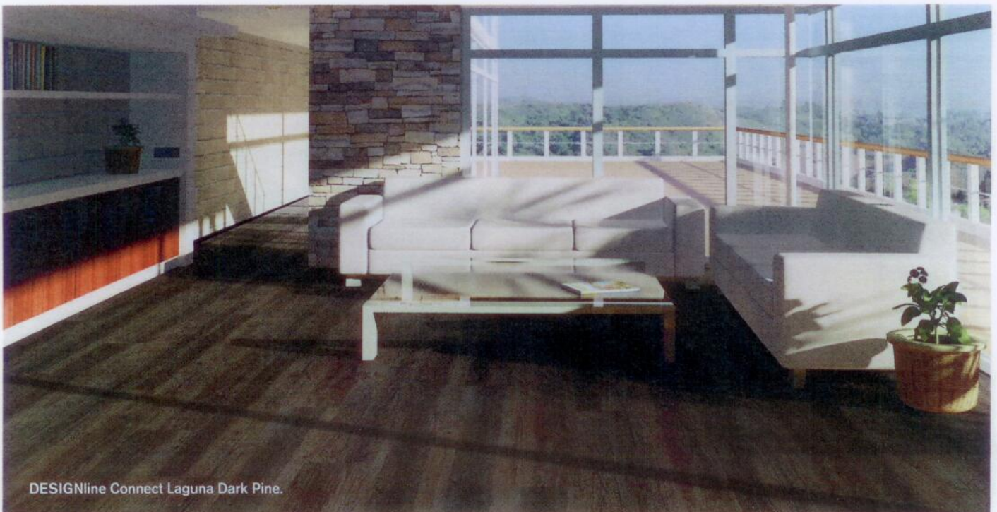
DESIGNline Connect Laguna Dark Pine.

De stroken hebben aan de kopse kanten een drop down -systeem. Mommersteeg: "Dit is noodzakelijk omdat onze kunststof stroken natuurlijk veel flexibeler zijn dan een HDF-drager. Zeker in de zomer kun je de strook niet meer recht optillen als je de lange zijdes in elkaar hebt geklikt. Met een drop down -systeem kun je ook de kopse kanten dan makkelijk verbinden." Windmöller Flooring heeft zijn kliksysteem in massieve pvc/vinyl-stroken gepatenteerd. Voor