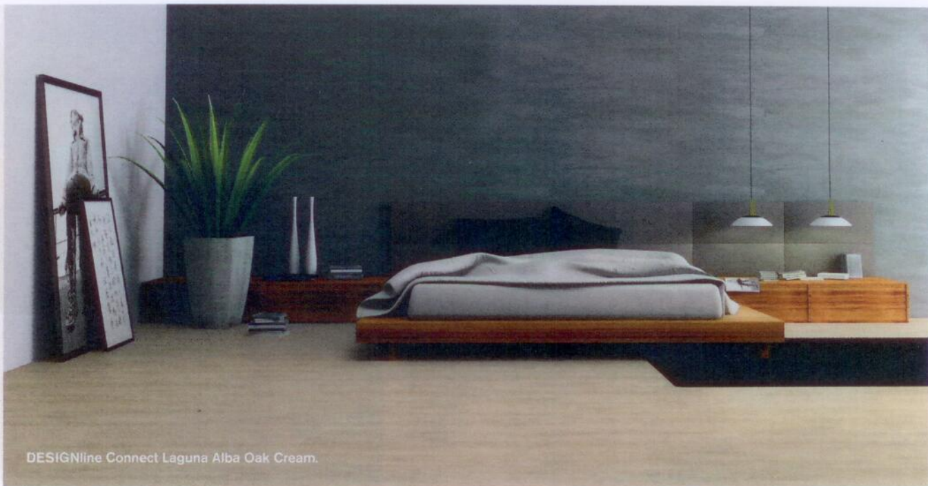
DESIGNline Connect Laguna Alba Oak Cream.

mersteeg aan. Met zijn bedrijf Mommersteeg BV is hij de agent van Windmöller Flooring voor Nederland. De distributie wordt gedaan door de groothandels Agco+Guidro in Eindhoven ( www.agcoguidro.nl ), Dersimo in Maassluis ( www.dersimo.nl ) en Viehoff Fournituren in Heerhugowaard ( www.viehoff-fournituren.nl ). Mommersteeg BV bewerkt zelf de architecten en projectinrichters.